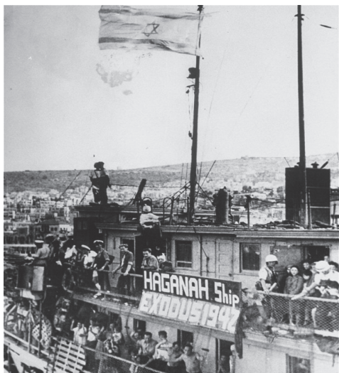
非合法移民を乗せた「エクソダス号」

予価 2,000 円+税 / A5 判 並製 / 3 月下旬発売予定 / ISBN978-4-86722-126-6 C0022